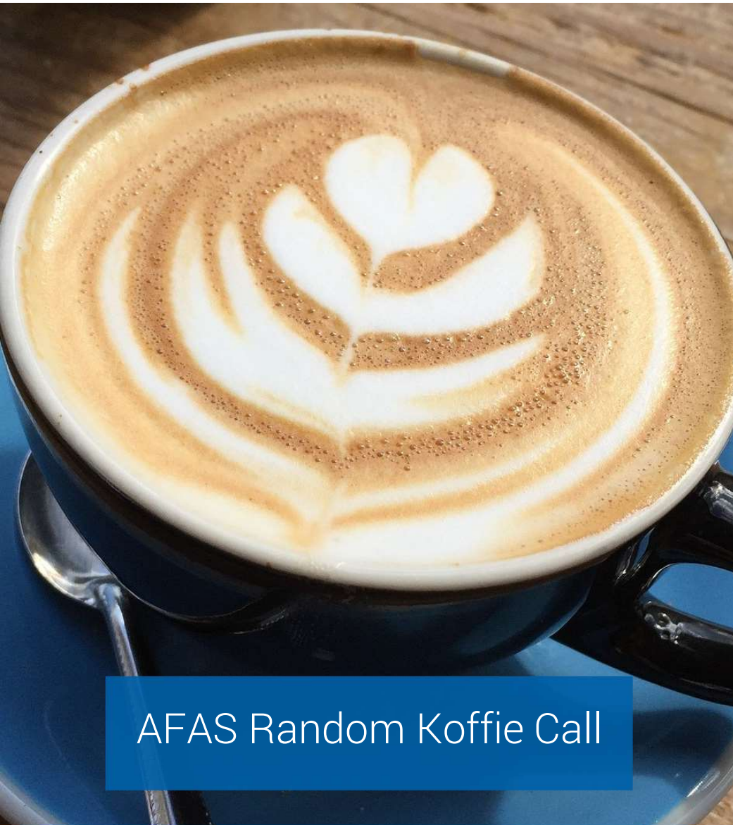
AFAS Random Koffie Call